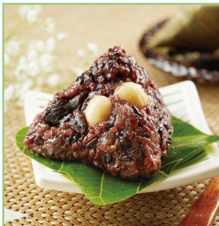
台灣好粽 紫米紅豆蓮子粽 產地：台灣 規格：80g±5g×6入/盒， 共2盒 保存期限：180天

宅配 冷凍 全素 美廉價：758 12入 5/31前限時特價 FREE 免運費 699 元