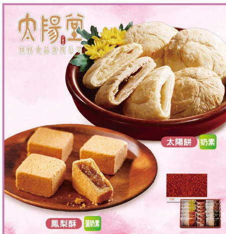
太陽堂 豪華禮盒 (太陽餅×12+鳳梨酥×6) 產地：台灣 規格：900g(原味x3+蜂蜜x3+ 咖啡x3+黑糖x3+ 鳳梨酥x6入)，附提袋 保存期限：3個月

宅配 冷凍 奶素 美廉價：738 2盒 5/31前限時特價 FREE 免運費 699 元