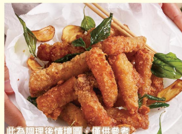
此為調理後情境圖，僅供參考