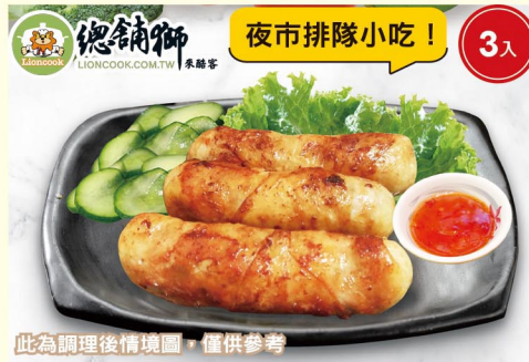
此為調理後情境圖，僅供參考