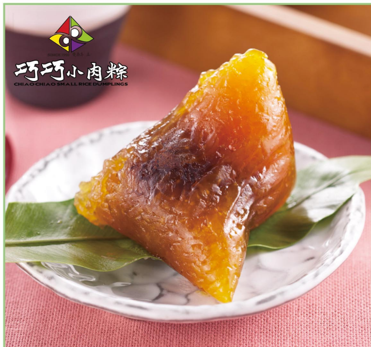
巧巧小肉粽 紅豆鹼粽 產地：台灣 規格：160g x 6入 保存期限：180天