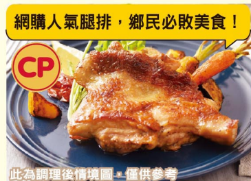
此為調理後情境圖，僅供參考