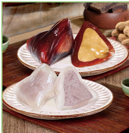
蔡爸爸的私房菜 經典水晶冰Q粽組 產地：台灣 規格：黑糖花生冰粽50g x 3入+ 水晶芋頭冰粽50g x 3入/包， 共2包 保存期限：2年

宅配 冷凍 全素 美廉價：758 12入 5/31前限時特價 FREE 免運費 699 元