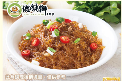
此為調理後情境圖，僅供參考