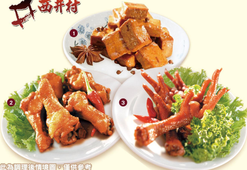
此為調理後情境圖，僅供參考