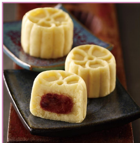
九利臻 綠豆糕禮盒 產地：台灣 規格：20g x 15入/盒，共2盒 保存期限：180天

宅配 冷凍 奶素 美廉價：738 2盒 5/31前限時特價 FREE 免運費 699 元