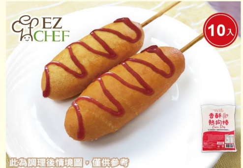
此為調理後情境圖，僅供參考