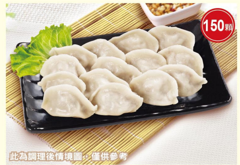
此為調理後情境圖，僅供參考