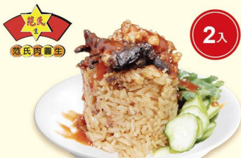
此為調理後情境圖，僅供參考